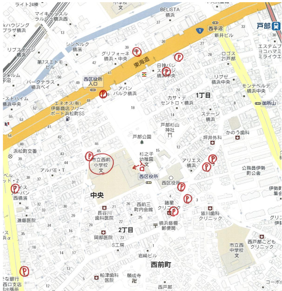
西前小学校案内図、駐車場案内図